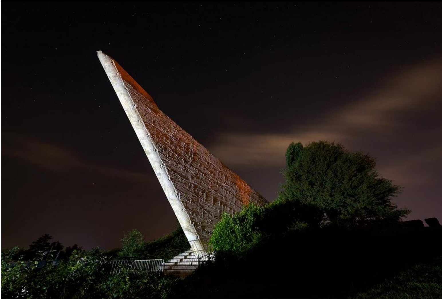
Огромный и зловещий памятник на кладбище Викторовац в Сисаке, Хорватия, указывает на ночное небо.