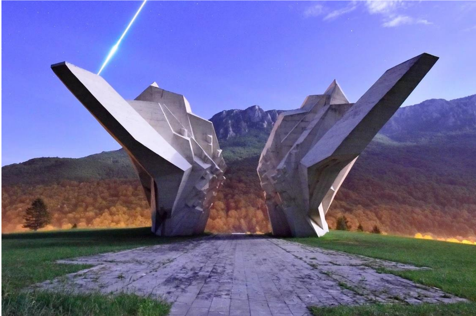
Расположенный в Боснии, зубчатый и симметричный памятник Тентиште увековечивает битву при Сутеске в 1943 году, когда силы Оси атаковали партизанские силы.