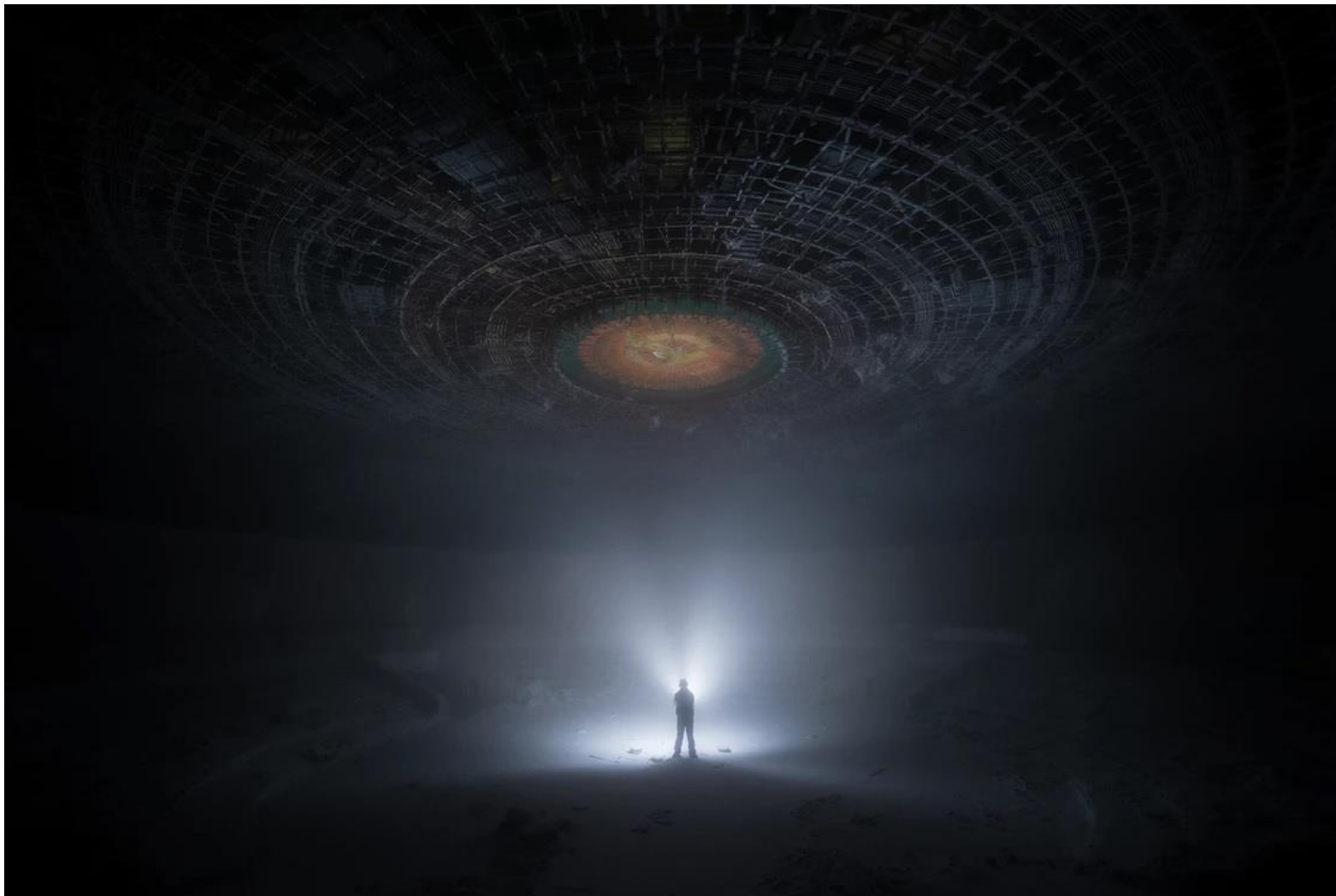
Мемориальный дом Коммунистической партии Болгарии на пике Бузлуджа. Интерьер