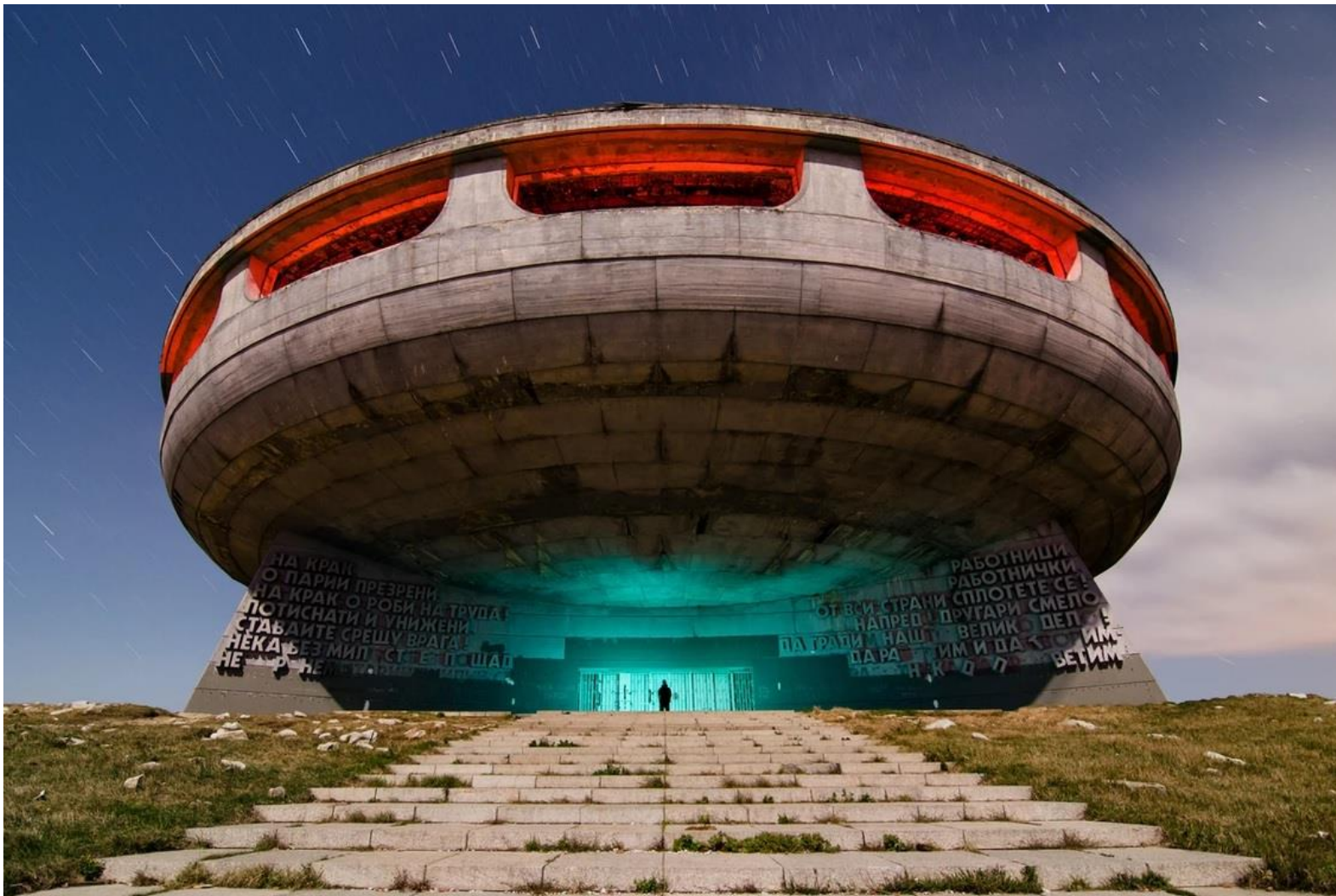
Мемориалният дом на Болгарската комунистическа партия