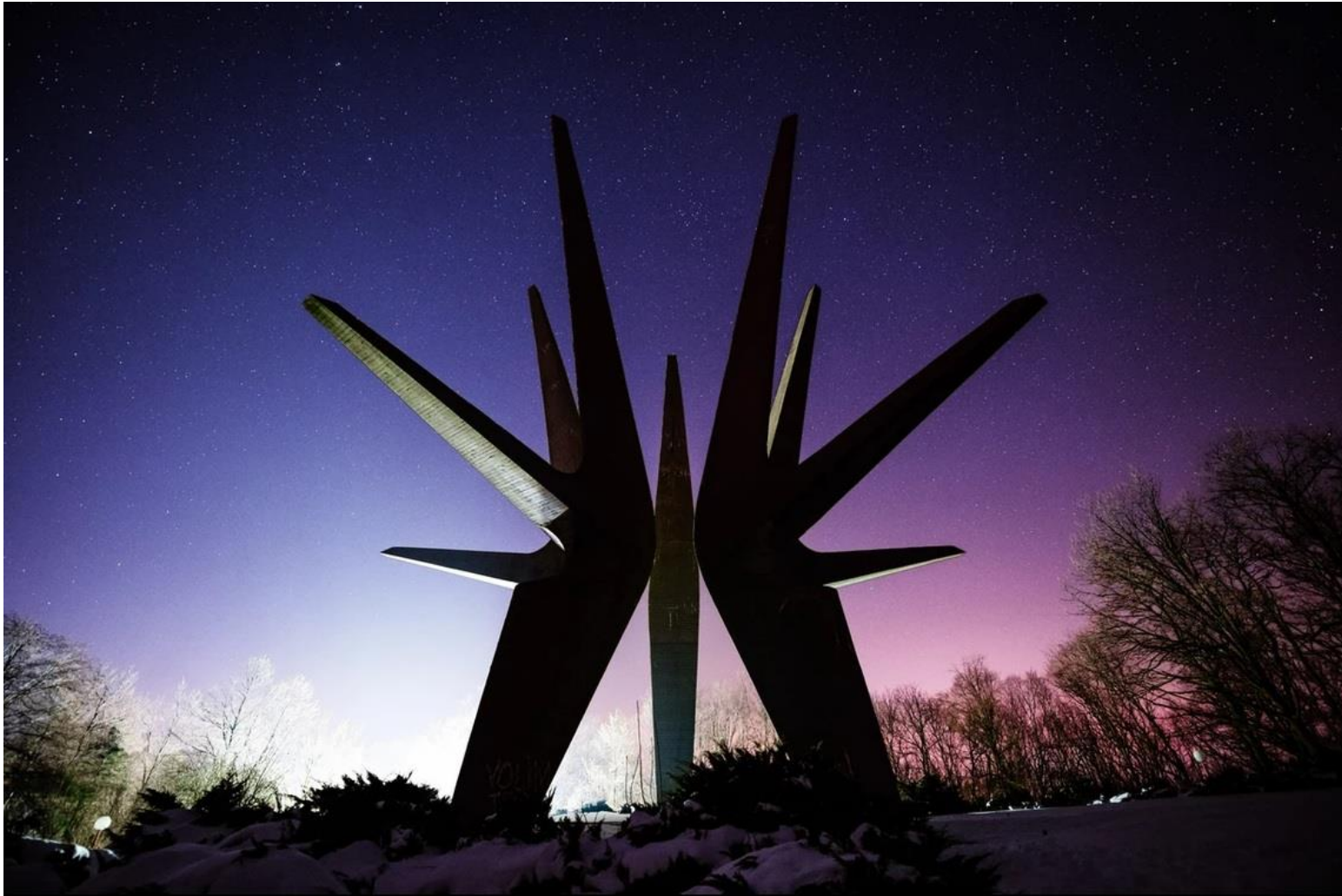
Мемориальный комплекс Космай в Сербии с потрясающей звездообразной структурой, которую Марк сфотографировал на фоне столь же звездного ночного неба.