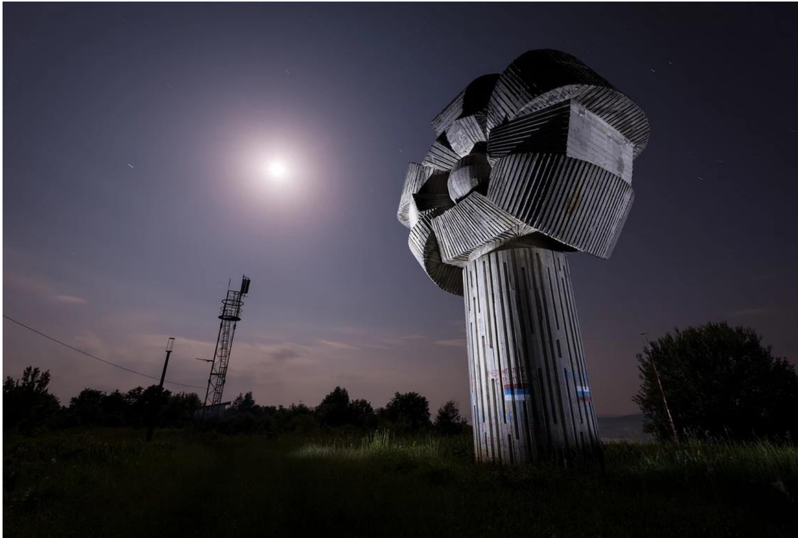
Памятник Глигино Брдо в Боснии имеет высоту 10 метров и по форме напоминает цветок, но вандализм и граффити видны на внешней стороне внизу.