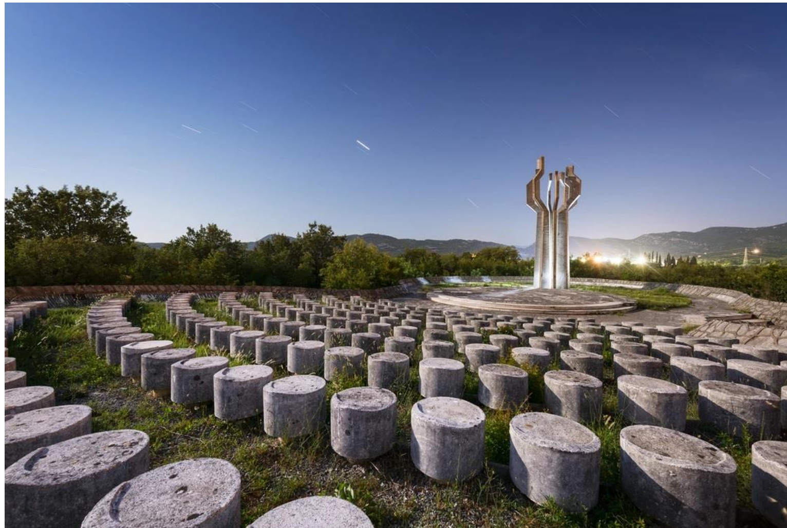
Потрясающая Барутана — памятник павшим из района Льешаньска Нахия — стоит гордо, как огромное дерево на фоне горных хребтов.