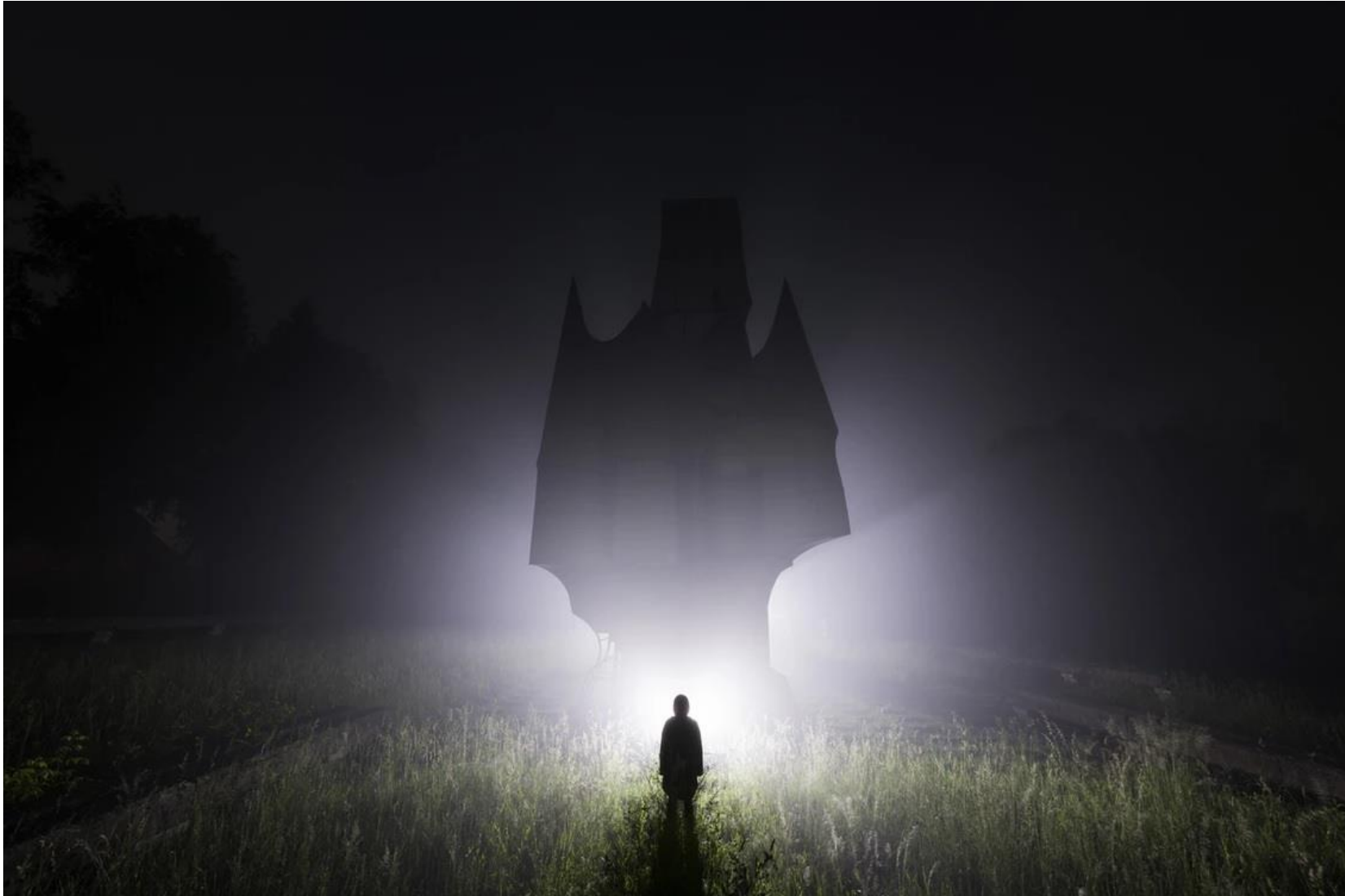
этот снимок, сделанный в комплексе памятников Шушняр в Боснии.